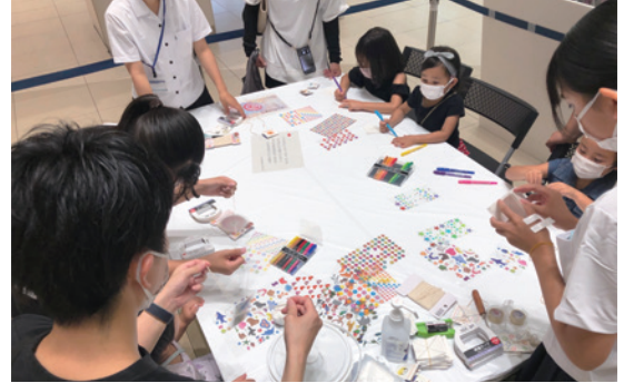
おもちゃは全部で4種類。ブンブンゴマやコマを作成した。

学校がユネスコスクールに認定されていることもあり、もともとSDGsに関心があったという駿河総合高校の6人。持続可能な社会を実現するためには自身の行動だけでなく、地域社会全体の取り組みが必要だという思いから、啓発のためのイベントやボランティア活動の企画・運営を行う、有志団体USを立ち上げた。コンセプトは「私たちが暮らしやすい明日を地球規模で考える」だ。